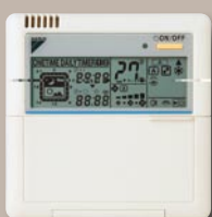
FTXS-G Bedrade afstandsbediening (optioneel)